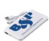
モバイル バッテリー