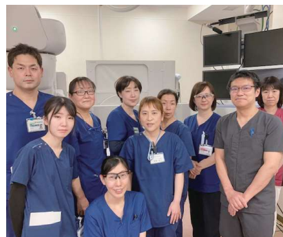
内視鏡センター スタッフの皆様