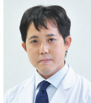
大阪労災病院 消化器内科 医長