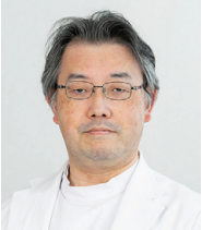
大阪労災病院 消化器内科 消化管内科部長