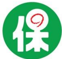
生命保険乗合代理店 業務品質認定マーク

当社はプライム市場上場企業の保険代理店として、お客さまのご期待にお応えできるよう、今後もさらなる業務品質の向上に取り組んでまいります。