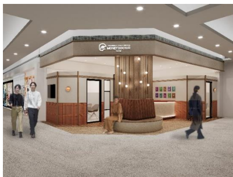
マネードクタープレミア あまがさきキューズモール店

あまがさきキューズモール店で、生活に欠かせない「お金」のお悩み相談・アドバイスを行い、地域の皆さまがいきいきと過ごすサポートをしてまいります。