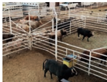
(画像はイメージです)