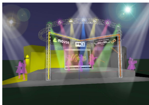
MCJ ブース ※イメージ画像