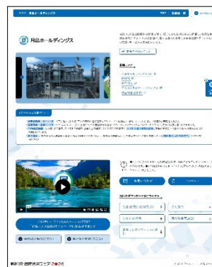
▲当社オンラインブース