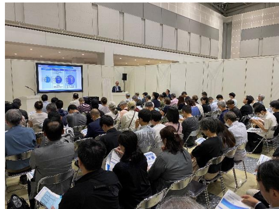
▲IR担当者による説明会の様子

IR担当者による説明会に関しましては、アーカイブ配信もございますので、ぜひご覧ください。