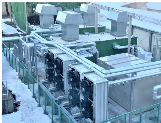
消化ガス発電設備

TJASは、下水処理場における汚泥処理に強みをもち、汚泥消化設備、ガス貯留設備および発電利用設備の豊富な実績を誇り、上下水道におけるPFI・DBO事業をはじめとした「ライフサイクルビジネス」を積極的に展開しており、長期事業運営に必要な豊富な実績とノウハウがあります。本事業においてもそれらを最大限に活かし、効率的で安定した発電事業の運営を行うとともに、脱炭素社会に貢献する消化ガス発電事業の普及拡大に積極的に取り組んでまいります。