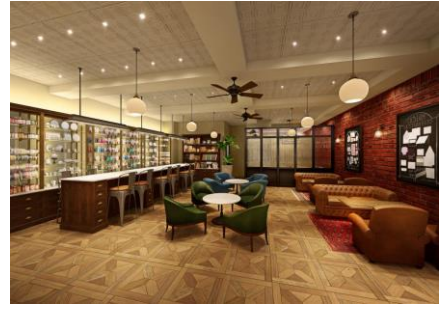
< 4階 - サロン >