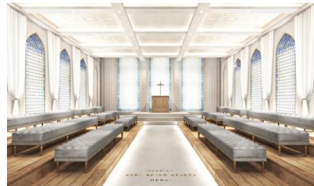
< 挙式スペース >

◆ 京都の人気エリア烏丸に出店。好立地を活かして広域からの集客を見込む 京都烏丸エリアは京都の中心部に位置し、古都の面影を色濃く残した、商業、観光の街であると同時に近年は新しい商業施設も集まり、ファッション、トレンドの発信地としても注目されています。新店舗は、京都のメインストリートの烏丸通りに面しており、阪急京都線「烏丸」駅、地下鉄烏丸線「四条」駅両駅より徒歩1分、さらには京都駅からも至近と交通アクセスが抜群の立地を誇ります。京都北山エリアにある1号店の「北山迎賓館」とはエリアおよび店舗のテイストを異にすることで、ウェディング実施場所として人気が根強い京都において多くの顧客の利用を見込むとともに、地域と業界に新たな価値提供をしてまいります。