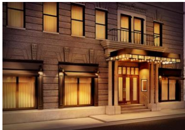
< エントランス >

同店舗は、街並みとの調和を大切にシックで上質感あるエントランスや、トレンドを発信する街ニューヨーク・ブルックリンのスタイルをイメージしたデザインが特徴的で、伝統と革新が息づく京都にふさわしい空間が創られています。優れたデザイン性と新たなスタイルのウェディングサービスを通じて、話題性の高い施設づくりをしていくとともに、京都の歴史と顧客の心に深く刻まれる結婚式を提供してまいります。