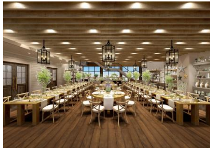
< 5階 - バンケット >