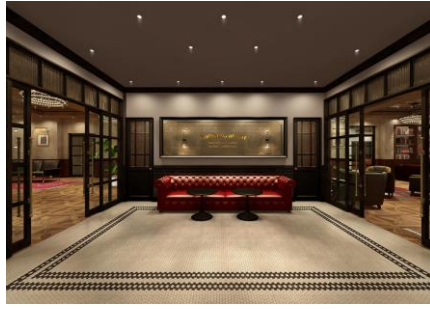
< 3階 - ロビー >