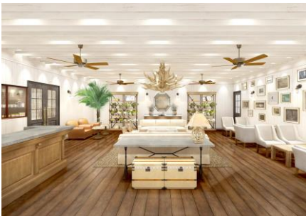
< 5階 - ロビー >