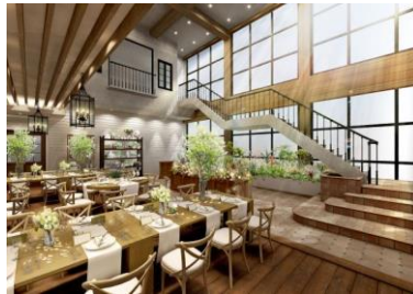
< バンケット >