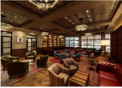
< 3階 - ロビー >