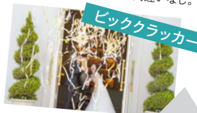
ビッククラッカー

紐を引くと、大きなクラッカーから沢山の華やかなテープが! 大きな歓声が上がること間違いなし。