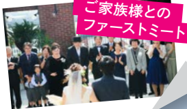
ご家族様とのファーストミート

ご新郎ご新婦ではなく家族で行うファーストミートは最近話題! 晴れ姿を見た瞬間、感動に包まれます。