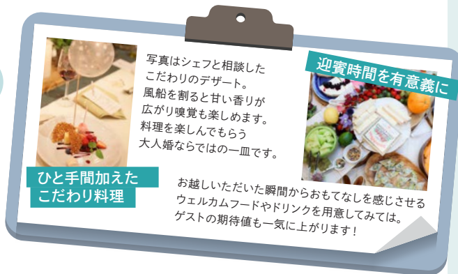
ひと手間加えたこだわり料理

写真はシェフと相談したこだわりのデザート。風船を割ると甘い香りが広がり嗅覚も楽しめます。料理を楽しんでもらう大人婚ならではの一品です。