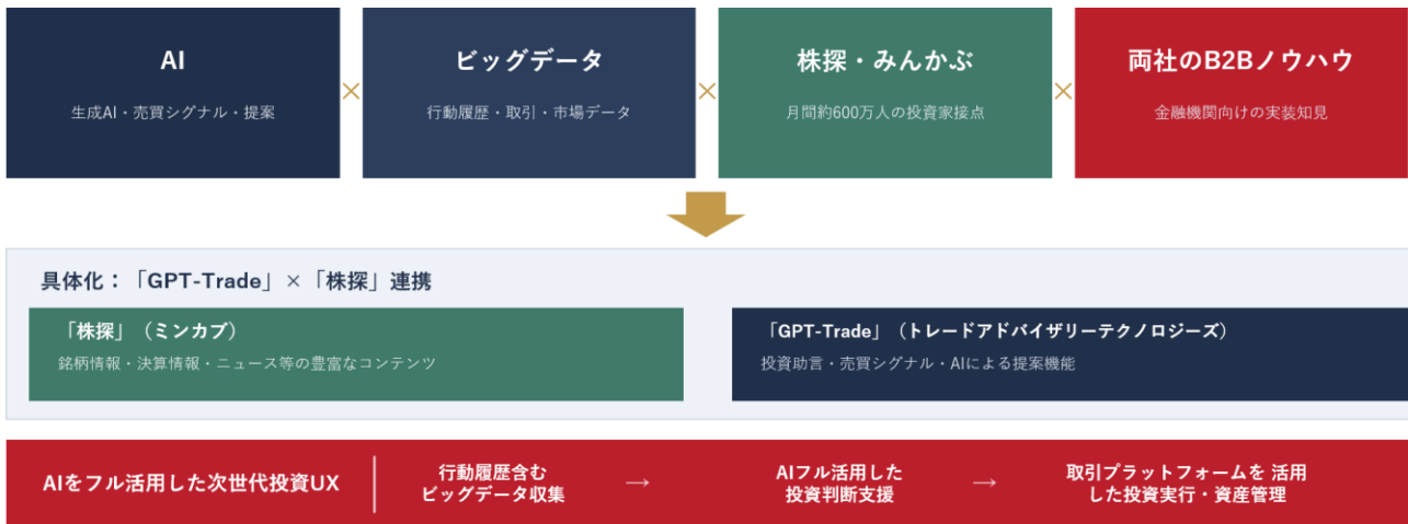
図3：個人投資家の投資体験フロー（情報収集 → AI による投資判断支援 → 取引実行・資産管理）

トレードワークスの子会社である株式会社トレードアドバイザーテクノロジーが運営する投資助言サービス「GPT-Trade」と、ミンカブが運営する国内最大級の個人投資家向け株式情報メディア「株探」との連携を進め、個人投資家向けの新たな UX 構築を推進します。「株探」が有する銘柄情報・決算情報・ニュース等の豊富なコンテンツと、「GPT-Trade」が有する投資助言・売買シグナル提供機能をシームレスに組み合わせることで、情報収集から投資判断支援、取引実行・資産管理までを、AI をフル活用してシームレスに行える体験の創出を目指します。