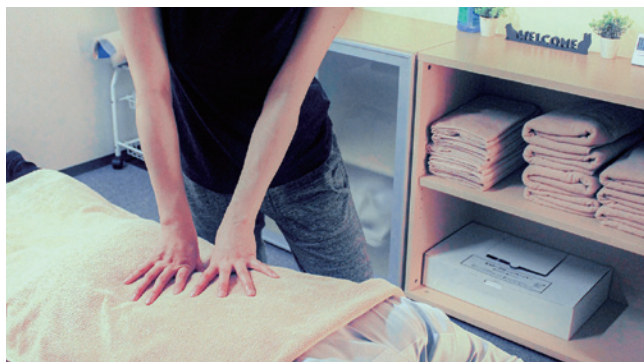
マッサージルーム

メンバーが心身ともにリラックスした状態で仕事ができるよう、鍼灸師が常駐してマッサージルームを社内で運営しています。従業員は勤務時間中に施術を受けることが可能です。