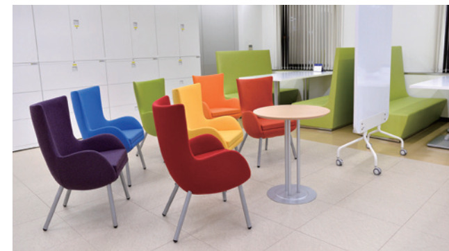
リフレッシュスペース

ちょっと一息つきたいとき、黙々と仕事をしたいとき、ミーティングしたいとき、お茶やコーヒーを淹れたいとき、ランチをとりたいとき、自由に使えるフリースペースがあります。