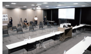
株主総会の裏側をお見せします！