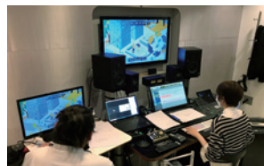
ビジョンムービー制作風景