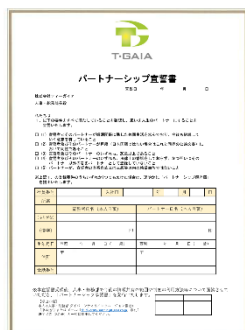
(パートナーシップ宣誓書)

ティーガイアは今後も、当社の根幹を成す人材のダイバーシティ&インクルージョンを積極的に推進し、新たな時代や変化を先取りできる「人財」を育成することで、「ICT周辺総合事業会社」として競争力を強化すると共に、更なる企業価値向上と持続的成長を図ってまいります。