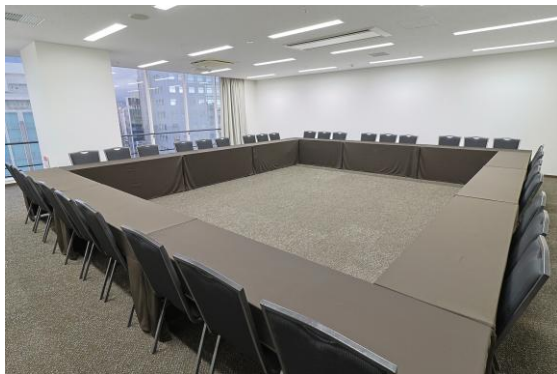
カンファレンスルーム 7I