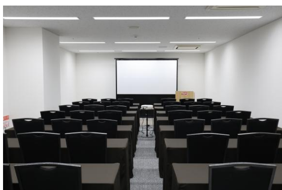
カンファレンスルーム 7G

貸会議室「TKP 静岡駅ビルパルシェカンファレンスセンター」は、既存の会議室に加え、今回新たに6室を増設し、8名～最大162名を収容できる全13室(総面積888㎡)を備えた施設になります。最大217㎡のバンケットホールや各種ミーティングルーム、カンファレンスルームを完備しており、会議、研修、セミナーなど多様なビジネスシーンに対応します。