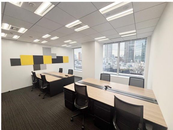
レンタルオフィス(個室)