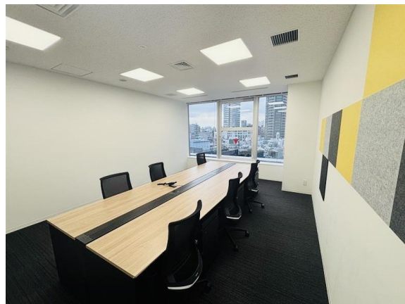
レンタルオフィス(個室)