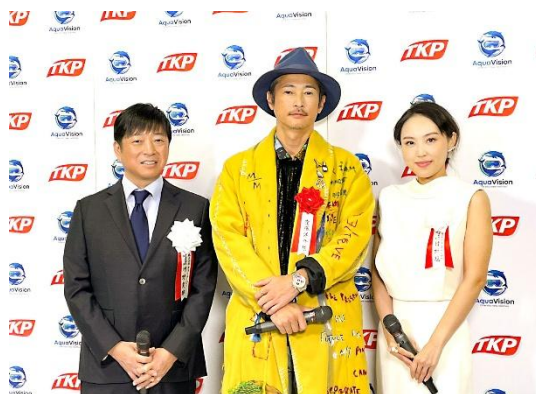
オープニングセレモニー後の囲み取材