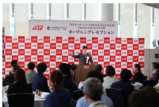
オープングレセプション