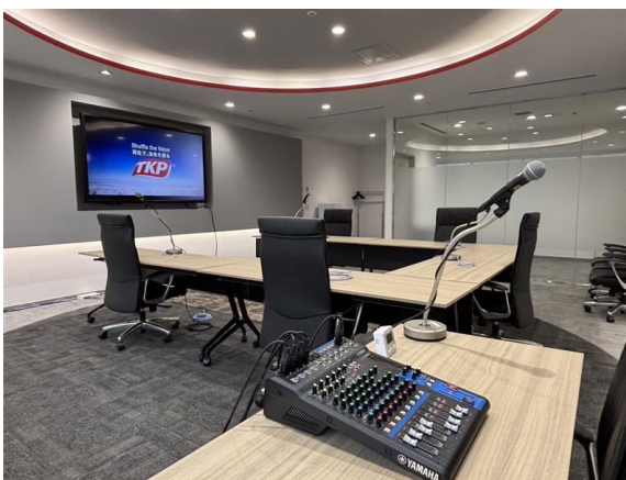
カンファレンスルーム 33G