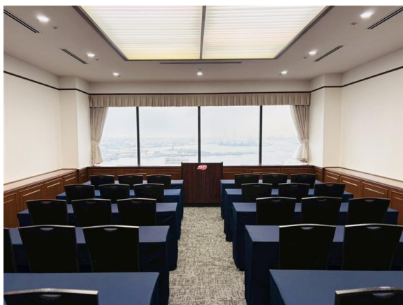
カンファレンスルーム 33E