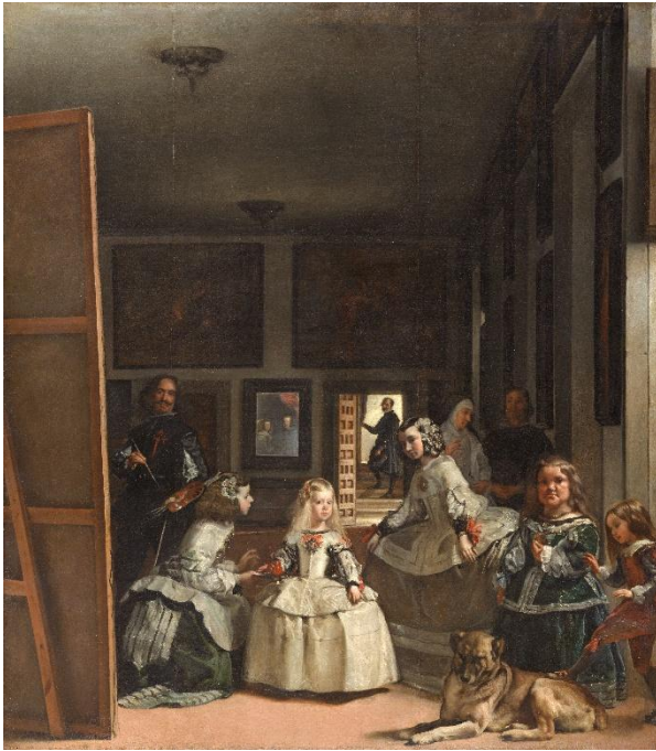
ベラスケス『ラス・メニーナス』(1656)