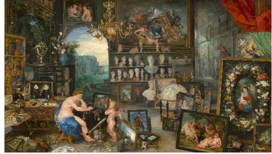
ブリュッゲル/ルーベンス『視覚の寓話』(1617)