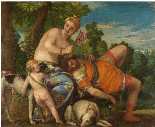
ヴェロネーゼ『ヴィーナスとアドニス』(約 1580)