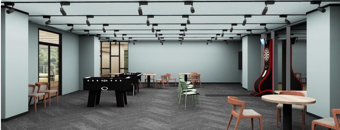
アクティブラウンジ