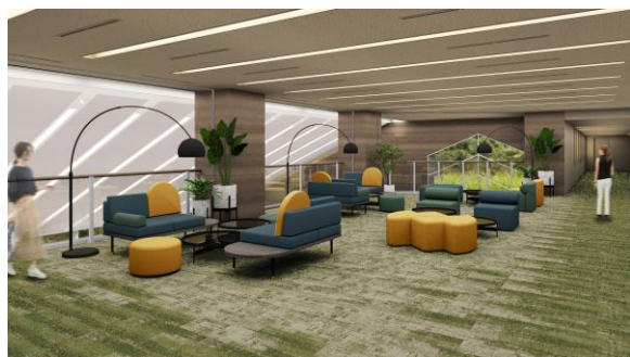
インフィニティリビング