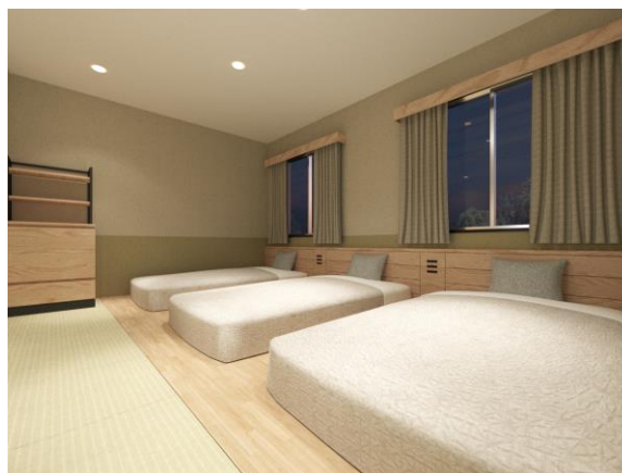
客室(スーペリアルーム)