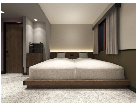
客室(スタンダードルーム)