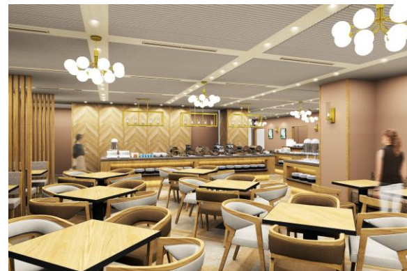
ビュッフェレストラン「薪火」