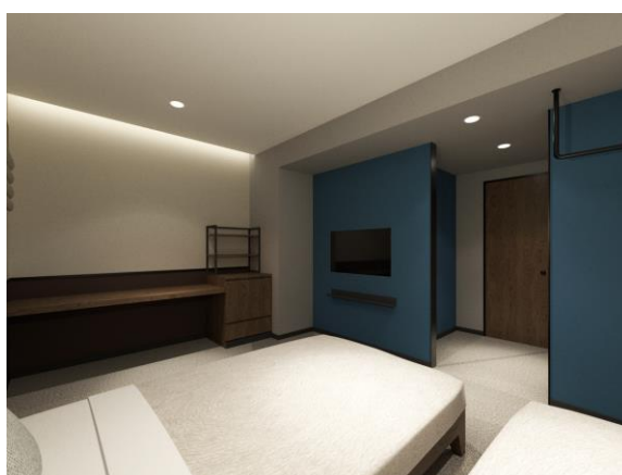
客室(スタンダードルーム(5階/6階))