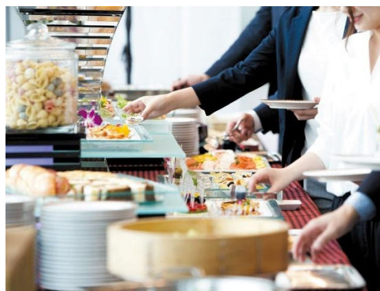
懇親会・パーティーなどの集まりにも最適