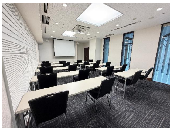
カンファレンスルーム 2C