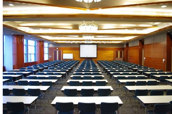
カトレア(連結利用)