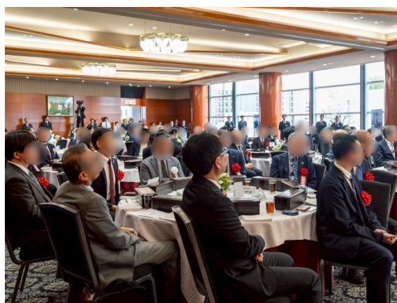
オープニングレセプション