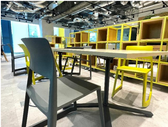
コワーキングスペース