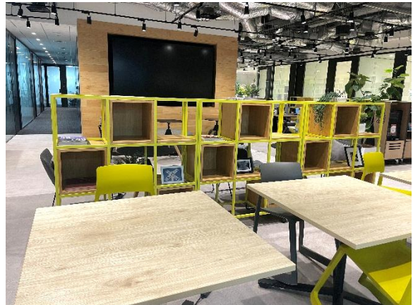
コワーキングスペース