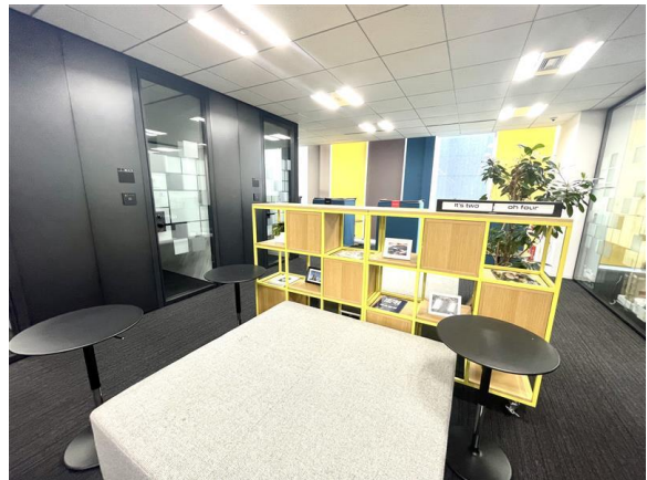
コワーキングスペース