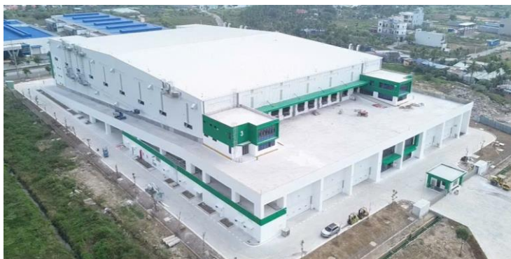
セムコープ ロジスティクスパーク（トゥイグエン）外観