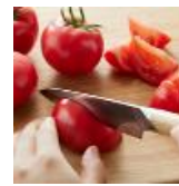
酸味と甘みの主役トマト