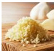
ガツンと旨いの源ニンニク