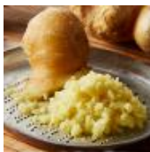
ピリっと刺激のあるおろししょうが

味味の土台となるのは、おろししょうが、ニンニク、ごま油、そして辛さの決め手カイエンペッパー。選りすぐりの食材で、唯一無二の香りと辛さを実現しました。旨みがぎゅっとつまった丸亀製麺の特製のカレーだしと合わせて、お店で大きめにカットした生のトマトを投入。仕上げに、溶き卵を加えて、酸味と甘みを引き出し、味わい深い一杯に仕上げました。