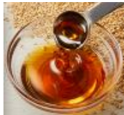
香り豊かなごま油