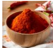
甘みと辛さの決め手カイエンペッパー