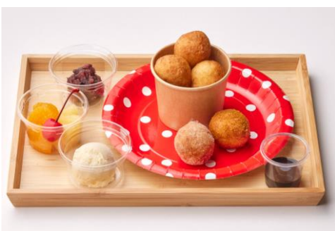
「丸亀うどんかつ もっちり満喫セット」