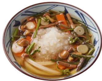
『山菜おろし冷かけうどん』(冷)

だして煮込んだなめこ、ぜんまいなどの彩り豊かな山菜の食感、特製の冷たいかけだしに浸った大根おろしのさっぱりした味わいが、のどごしの良いうどんにぴったりな一杯です。