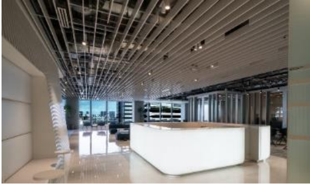
〈ビジネスエアポート竹芝〉