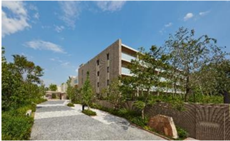
<世田谷中町プロジェクト>