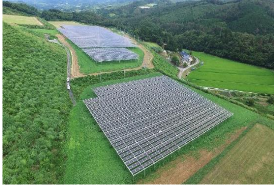
〈一関市吉高太陽光発電所〉