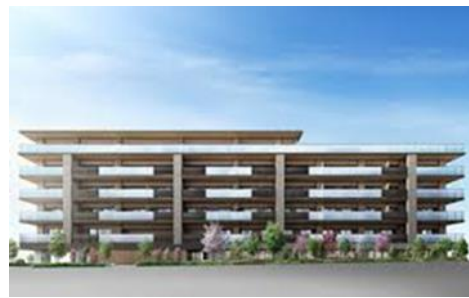
<グランクレール立川(2020年9月開業)>