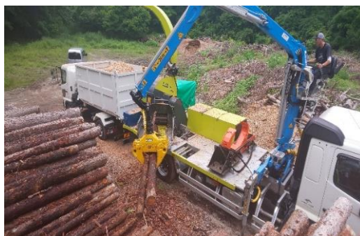
＜バイオマスボイラー木質チップ製造状況＞