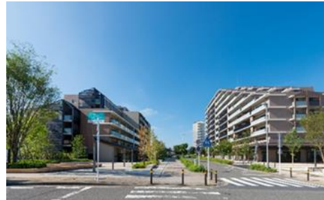
<横浜十日市場プロジェクト>