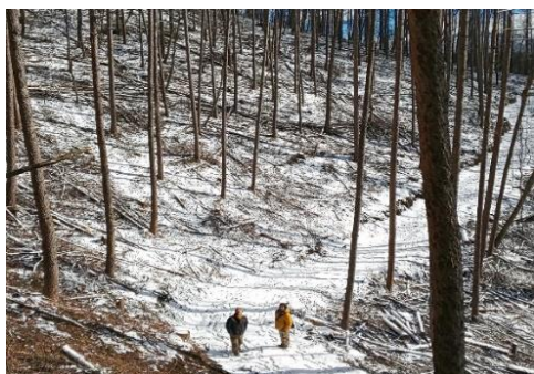
＜間伐後の蓼科の森＞