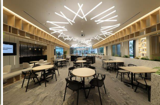
〈ビジネスエアポート日本橋〉