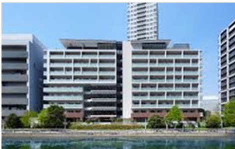
<グランクレール芝浦(2020年7月開業)>