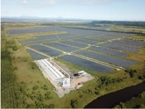
〈すずらん釧路町太陽光発電所〉