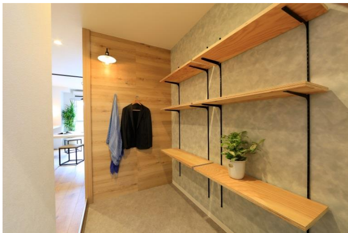
自転車なども入る大きな土間

コンロ ガスコンロ付 給湯 ガス 洗濯機置場 室内 洗面台 浴室と別 浴室 専用(トイレと別) シャワー 冷暖エアコン ベランダ あり インターホン TVモニターホン 居室照明器具 洗面所独立 温水洗浄便座