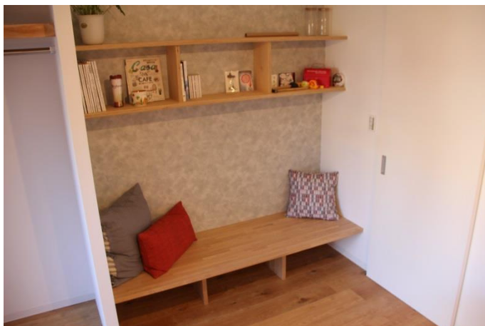
腰掛けられる広いベンチ。横になって寝ることも。