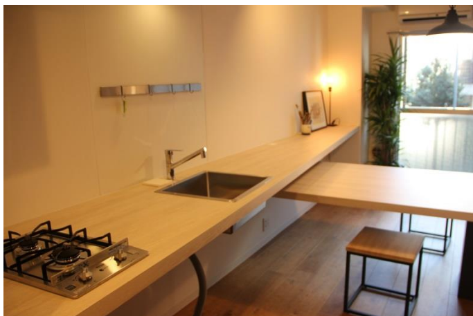
大きく広く使えるキッチン