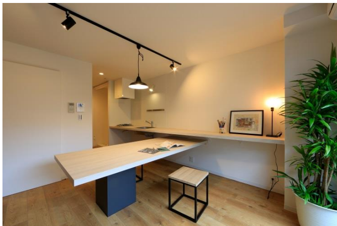
資料を広げたり作業をしたりできるデスク