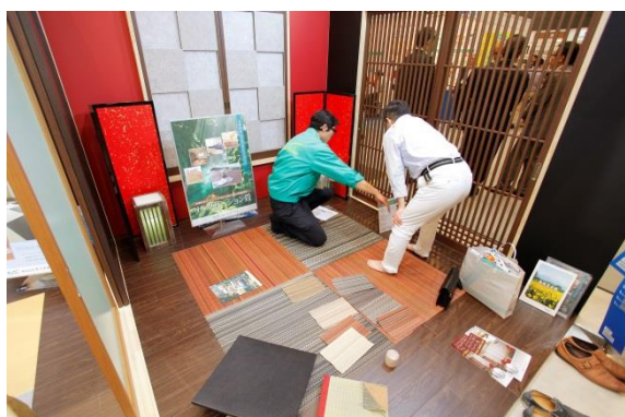
わかりやすい実物大展示の住宅設備