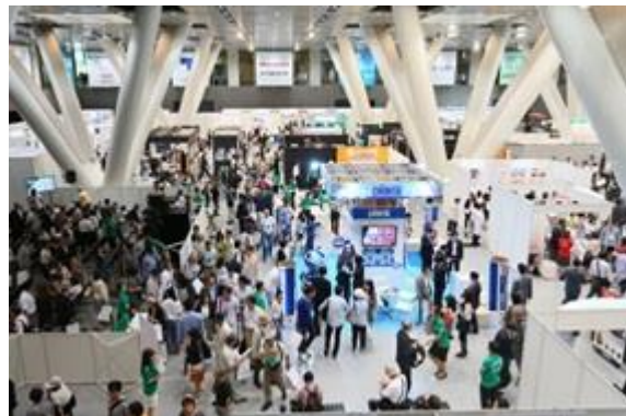
通路を埋め尽くすほどの来場者