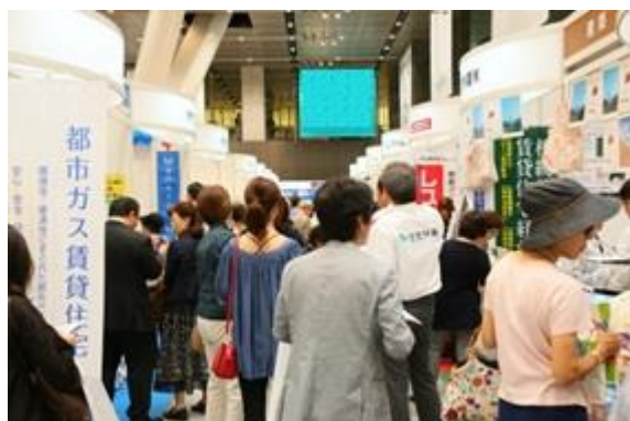
にぎわいを見せる各企業の出展ブース