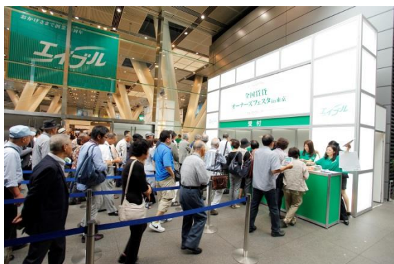
多くの来場者で混雑する受付