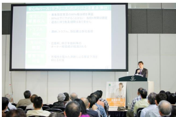
著名人や専門家によるセミナー講演