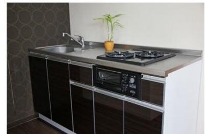
システムキッチン(アイリスオーヤマ)