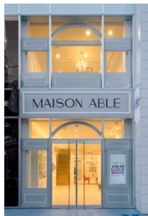
ショップファサード

住所 : 東京都渋谷区神宮前6-7-15 YOビル1・2F フリーダイヤル : 0120-897-880 (コンシェルジュ予約専用ダイヤル) 電話 : 03-6418-1180 営業時間 : 11:00~19:30 水曜定休 最寄駅 : 東京メトロ副都心線 明治神宮前「7番出口」「エレベーター専用出口」より徒歩3分 店舗面積 : 1F / 92.24㎡ 2F / 77.61㎡