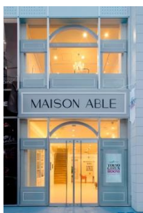
ショップファサード