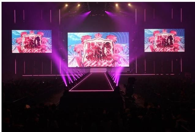
第18回 東京ガールズコレクション 2014 SPRING/SUMMER TOKYO GIRLS COLLECTION 2014 SPRING/SUMMER