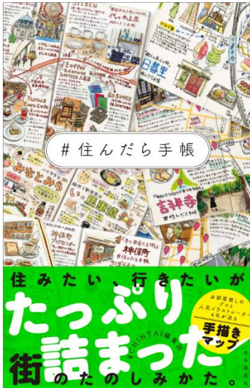
『#住んだら手帳』書籍 ※デザインは制作中のものです

今までInstagramでたくさんの街をイラストマップ化してきた『#住んだら手帳』がこの秋、書籍化することになりました。Instagramで紹介してきた街はもちろん、書籍化にあたって描きおろしの新規イラストマップも登場します！街での「暮らし」をイメージできるよう、その街ならではのエピソードや駅ごとの平均家賃相場なども掲載予定です。『#住んだら手帳』のInstagramでは、書籍が出来上がるまでの様子を紹介しているので、ぜひご覧ください。『#住んだら手帳』 Instagram URL: https://www.instagram.com/sundara_techo/