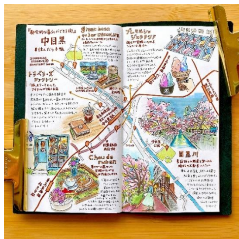
中目黒のイラストマップ illustrations by おふみ