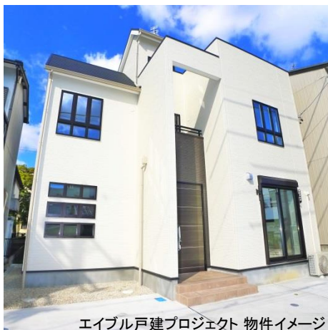
エイブル戸建プロジェクト 物件イメージ

2012年8月に、不動産賃貸業界初となるエコ長期優良戸建賃貸住宅(木造2×4構造)のコンサルティングを主としたプロジェクトです。本プロジェクトによる最大の特徴は『構造計算』された設計を基本事項として考え、さらに『耐震等級3』『省エネルギー対策等級4』『劣化対策等級・維持管理対策等級3』の基準をクリアしております。※現行の建築基準法では、木造2階建て建物(4号建築物)は壁量計算と言われる簡易的計算によって構造チェックされれば、構造計算は不要(4号特例)ですが、それらは木造建築基準の必須事項でなく、コスト面からもその実施が多くありません。