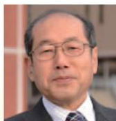
将棋棋士・投資家 桐谷 広人 氏