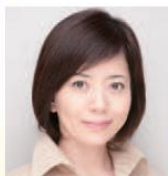
アナウンサー 草野 満代 氏