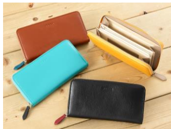
<JOGGO> シンプルラウンド長財布 13,000円

【三越伊勢丹初出店】 高品質なオリジナル牛革を使用し、一つずつ丁寧に縫製しています。しっかりと開くマチ設計で、見やすく取り出しやすいデザイン。左右にある収容量大のポケット、小銭入れは横まで開くL字型で、使いやすさと上質な造りに細部までこだわっています。