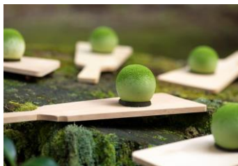
【立川店限定】 <野尻ケイク sweets store> 野尻ケイクのケーキセット 2個入り 1,944円

【サステナブルコスメアワード 最優秀賞 受賞】導入美容オイル。 ツバキやコメヌカ、オタネニンジンなど、植物の美容効果を活かす非加熱圧搾で精製したオイルが、洗顔後の肌をやわらかくし、化粧水を角質層まで浸透しやすく整え、乾燥しがちな肌を驚くほどなめらかにツヤのある肌へと導きます。