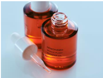
<NEMOHAMO> NEMOHAMO ブースターオイル 6,380円

【サステナブルコスメアワード 最優秀賞 受賞】導入美容オイル。 ツバキやコメヌカ、オタネニンジンなど、植物の美容効果を活かす非加熱圧搾で精製したオイルが、洗顔後の肌をやわらかくし、化粧水を角質層まで浸透しやすく整え、乾燥しがちな肌を驚くほどなめらかにツヤのある肌へと導きます。