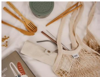
<Mana.ORGANIC LIVING> カトラリーセット 1,760円

【三越伊勢丹初出店】 高品質なオリジナル牛革を使用し、一つずつ丁寧に縫製しています。しっかりと開くマチ設計で、見やすく取り出しやすいデザイン。左右にある収容量大のポケット、小銭入れは横まで開くL字型で、使いやすさと上質な造りに細部までこだわっています。