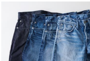
<SHIMA DENIM WORKS> デニムパンツ 36,300円

【三越伊勢丹初出店】 ジャスパーモリソンと熊野亘によるNIKARIを代表する傑作。無駄を極限までそぎ落としたシンプルでコンパクトなフレームにテンションをかけた座面はハンモックの様なホールド感。秀逸な座り心地と美しいフォルムにNIKARIの技が凝縮されています。