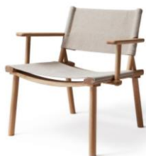
<NIKARI> December lounge chair 283,800円