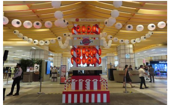
日本の夏祭りならではのやぐらがお出迎え

館内のエリアごとに、各季節の“祭り”をイメージして装飾を施し、各コンセプトにあったイベントを10日間にわたり実施。MITSUKOSHI BGCのグランドオープンを盛り上げています。