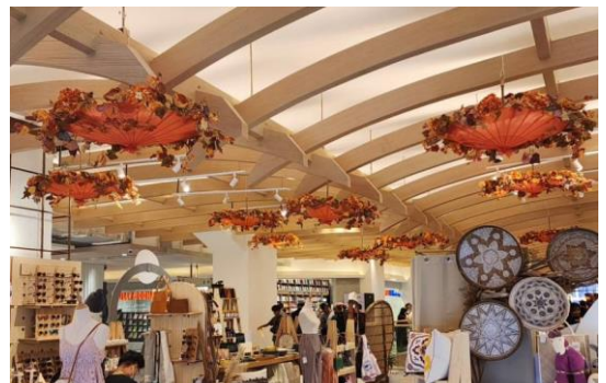
もみじと花で秋の紅葉を華やかに演出