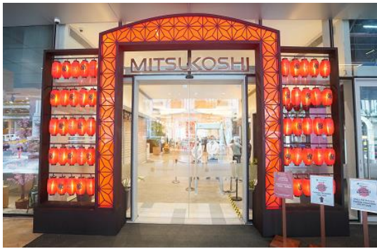
和柄とちょうちんが並んだエントランス

日本の四季折々の“祭り”をテーマに、四季の様々な楽しみ方をドラマチックに演出してご紹介をすることで、日本らしさ・三越らしさをフィリピンの皆さまへお伝えすることを目指しました。