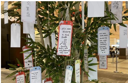
願いを込めた短冊をつるした笹の葉で七夕まつりを演出

館内のエリアごとに、各季節の“祭り”をイメージして装飾を施し、各コンセプトにあったイベントを10日間にわたり実施。MITSUKOSHI BGCのグランドオープンを盛り上げています。