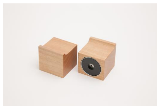
CUBE 型キッチンフック (1 個) ご所有株式 1,000 株以上 5,000 株未満の株主様向け