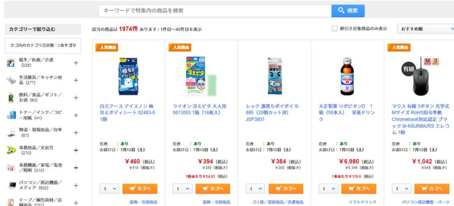
図1 まとめ割ページ https://www.askul.co.jp/coupon/matome/91H8476/0/ (18時よりオープン)