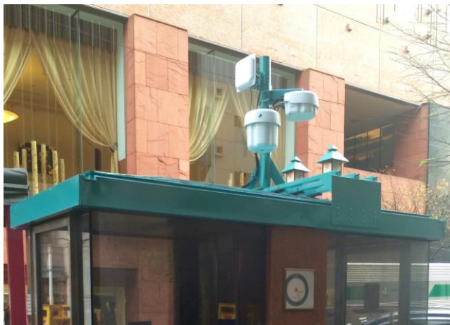
電話ボックスアクセスポイント