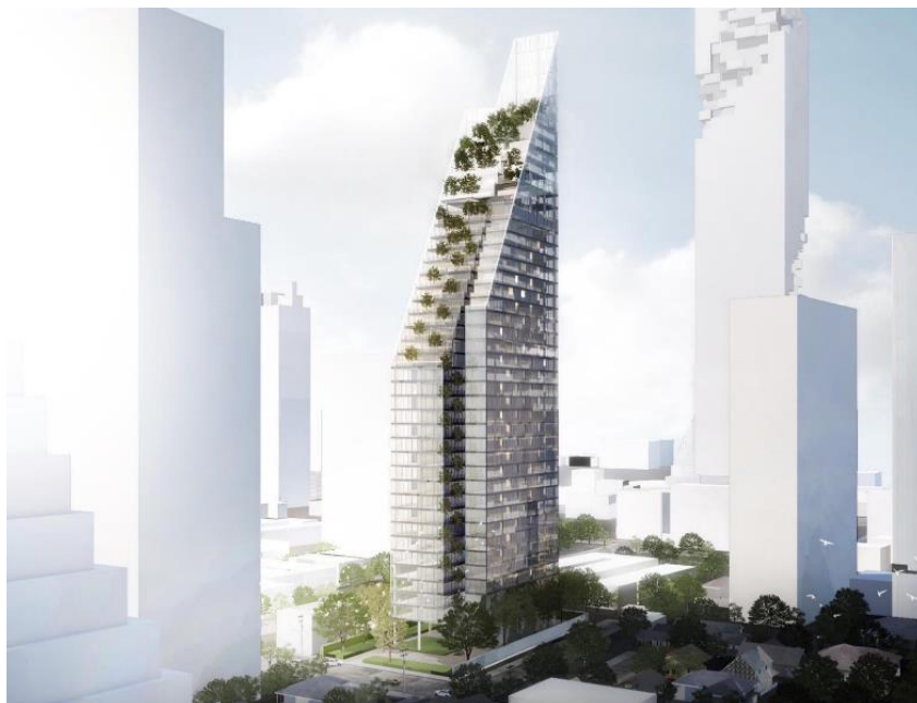
(仮称)サトーンプロジェクト完成予想CG

共同事業者となるレイモンランド社は 1987 年に設立された現地不動産デベロッパーであり、主に都心部においてアッパーミドル層以上をターゲットとした高品質かつ洗練されたデザインの商品を展開しており、現地で高い評価を得ている会社です。