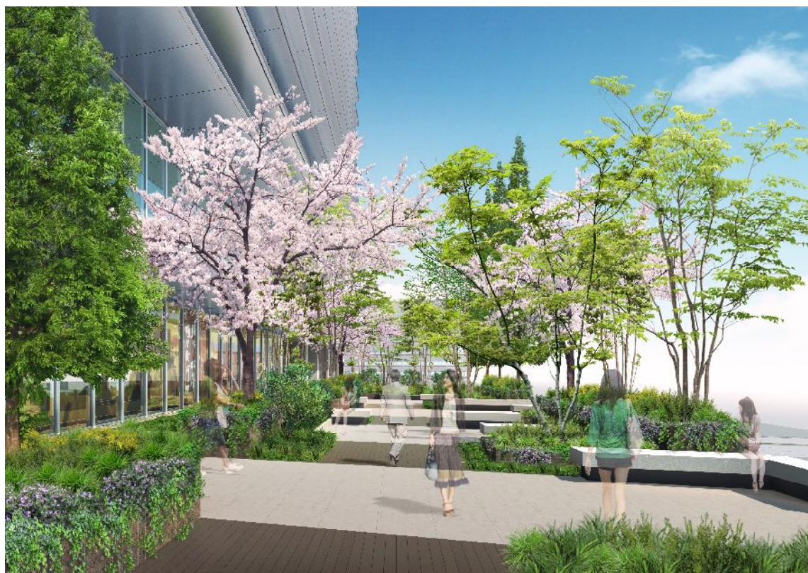
まとまった緑を形成し、憩いと交流の場としての機能をもつ「(仮称)京橋の丘」