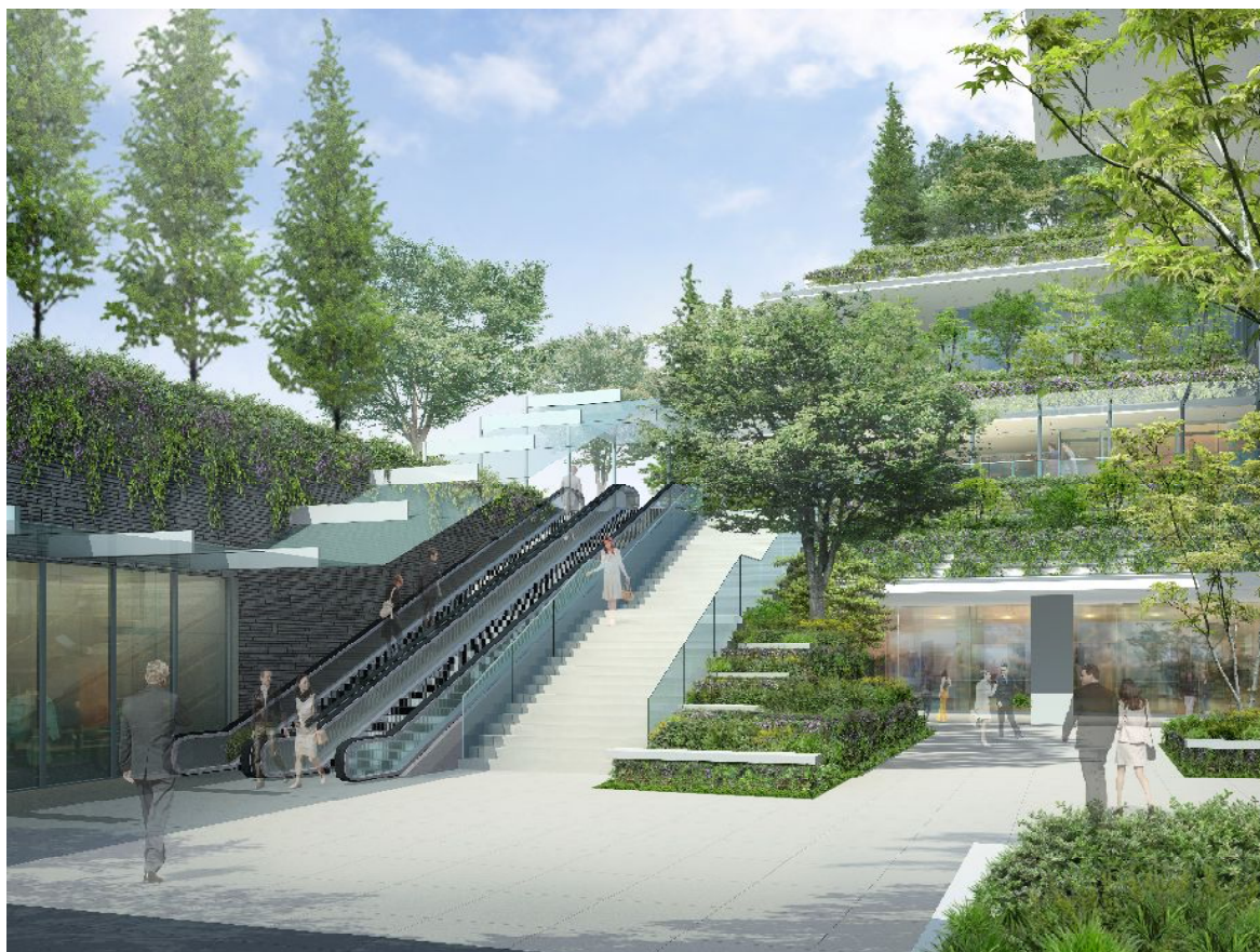
地下鉄「京橋」駅と直結する「地下駅前広場」