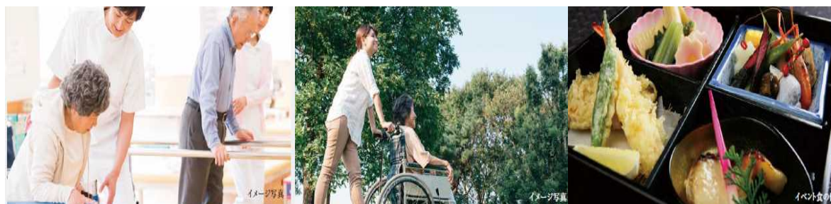
（個別リハビリ、外出支援や通院サポート、イベント食の各イメージ）

食事については、健康維持の観点から考えた栄養バランスはもちろん、季節食・行事食など、暮らしの楽しみになる食事を現地調理により提供します。管理栄養士が常駐し、ご入居者の体調に合わせた食事を提供します。