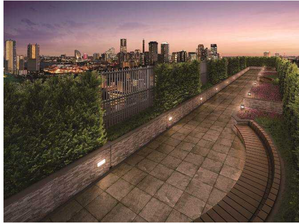
(イメージ/スカイガーデン)