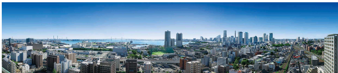
現地より約 70m 離れた建物(高さ約 66m)より、みなとみらい方面を望む。

総戸数 110 戸の全邸が南方位となっており、上層階からは横浜の街と海の眺望が広がっております。また、夜にはみなとみらいやベイブリッジの夜景が広がります。そんな眺望を楽しめるよう、地上約 68m の屋上には、みなとみらいを望み、緑に憩うスカイガーデンをご用意しました。