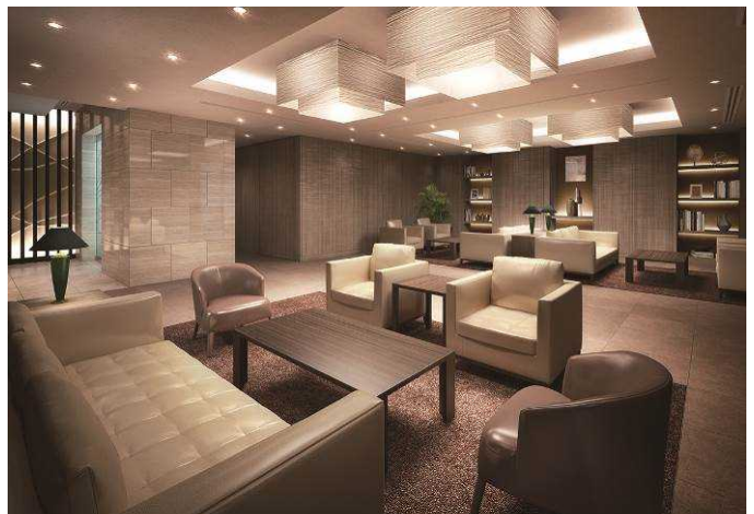
(イメージ/左：外観、右：エントランスラウンジ)