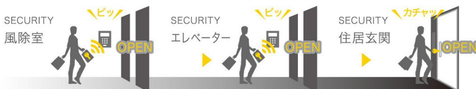
(セキュリティ概念図：鍵をカバン等に入れたまま自動扉を開錠できるハンズフリーキーを導入)

風除室とエレベーターの2箇所にオートロックシステムを採用しているセキュリティシステムの他、集合玄関インターフォンだけでなく専有部玄関扉にも録画機能カメラ付インターフォンを設置する等、セキュリティを強化。さらに、防災備蓄倉庫の設置や「Brillia」でグッドデザイン賞を受賞したオリジナル防災マニュアルを賃貸版にアレンジを施しご入居者様に提供する等、「Brillia」に準じたセキュリティシステム、防災対策を導入致します。