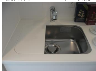
(限られたキッチン空間でも快適に料理を楽しむEシンク)