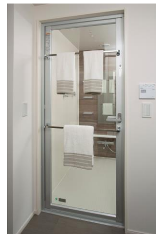
(マットも同時に掛けられる2段タオル掛け)