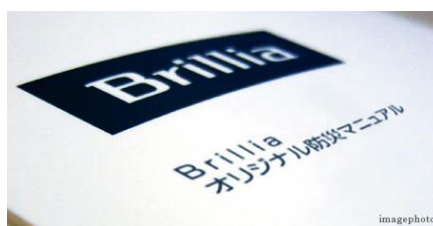
(参考：Brillia 防災マニュアル)