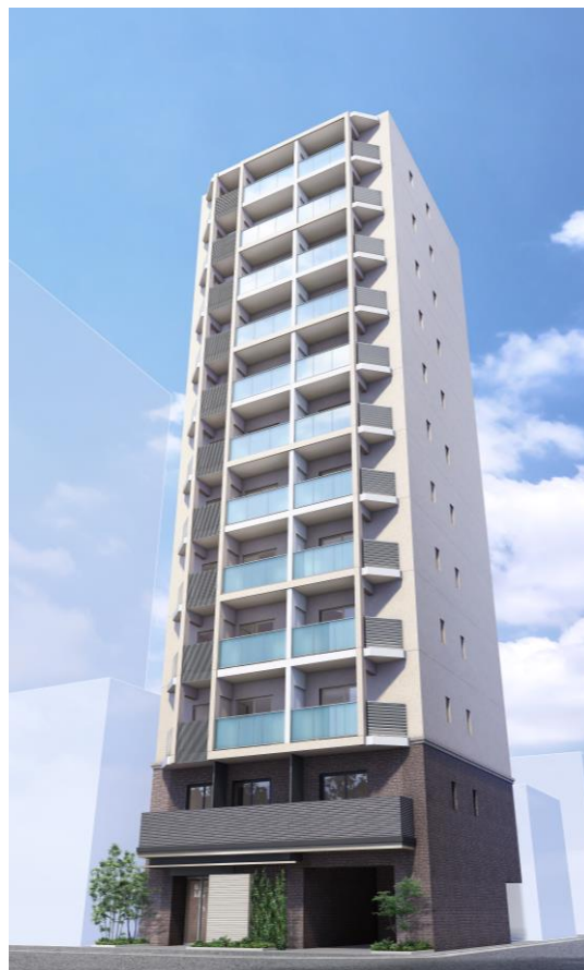
(Brillia ist 上野御徒町イメージパース)