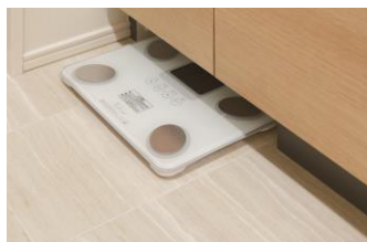
(洗面台下ヘルスマーター収納)

都心部の限られた空間においても快適に過ごすことができるよう、玄関コート掛けや玄関扉に鏡を設置、さらに浴室扉はタオルやマットを複数枚掛けることができる2段タオル掛けを導入する等、さまざまな工夫を施した設備を採用致します。