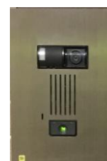
(玄関扉にもカメラ付インターフォンを設置)