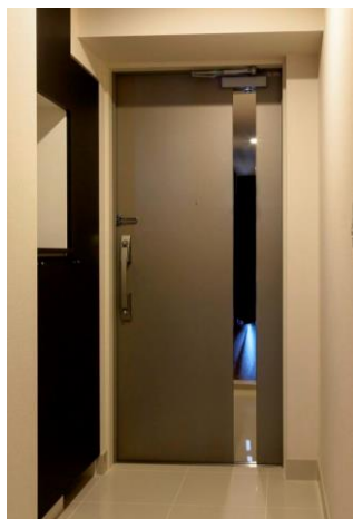
(出掛ける前に服装等を確認できる玄関扉鏡)