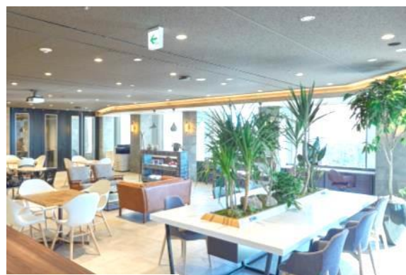
（コワーキングスペース）

サービスオフィスは「起業直後の少人数オフィス」や「短期間のプロジェクトルーム」に、コワーキングスペースは「テレワーク導入企業の社員の立ち寄り利用」や「個室を構える前のスタートアップ企業のオフィス」にと、幅広くご利用いただくことが可能です。