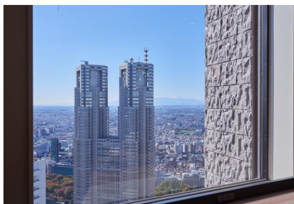
(晴れた日は富士山も望める新宿センタービル 49 階からの眺望)